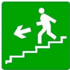
Scala di emergenza