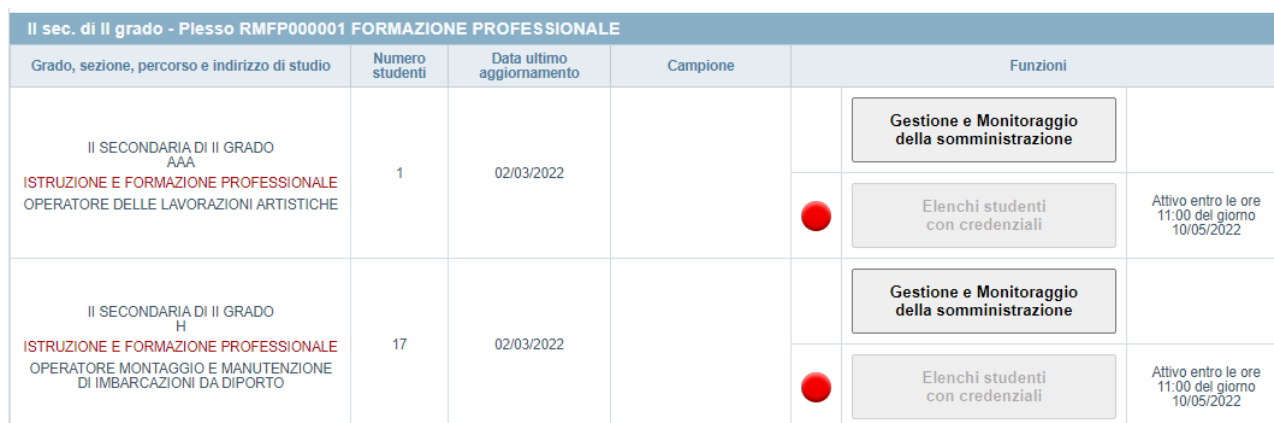
Figura 2: elenco delle classi o gruppi di studenti nel modulo web “Gestione e Monitoraggio della Somministrazione CBT”

Il modulo web “Gestione e Monitoraggio della Somministrazione CBT” visualizza, per ciascun grado, l’elenco delle classi o gruppi di studenti dell’istituto che somministrano le prove INVALSI computer based (CBT) (Figura 2).