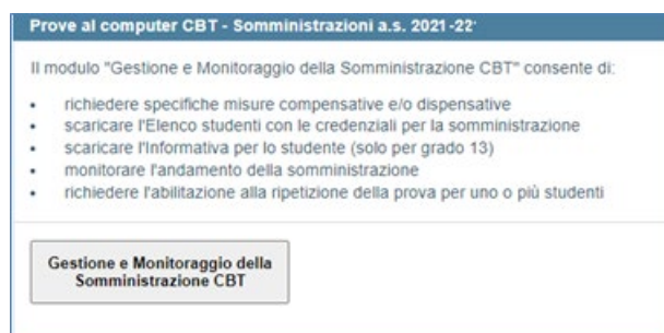
Figura 1: sezione “Prove al computer CBT - Somministrazioni a.s. 2021-22” per il Dirigente scolastico

Il Dirigente scolastico all’interno della propria area riservata ( https://invalsi-areaprove.cineca.it/?get=accesso ) seleziona la sezione “Rilevazioni Nazionali” e accede al modulo web “Gestione e Monitoraggio della Somministrazione CBT” attraverso il relativo pulsante (Figura 1).