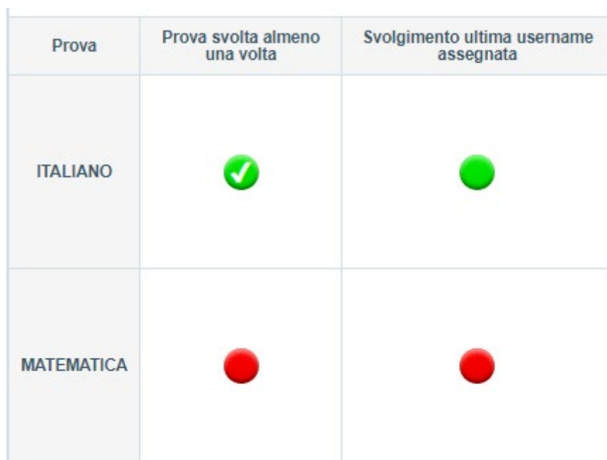
Figura 7: indicatori Svolgimento della prova per il monitoraggio della somministrazione

L'indicatore " Svolgimento ultima username assegnata " segnala se lo studente ha svolto la prova utilizzando le ultime credenziali assegnate. Ciò vuol dire che il colore dell'indicatore è legato alle richieste di modifica delle misure compensative e/o dispensative o di riabilitazione alla ripetizione di una prova eventualmente effettuate dal Dirigente scolastico.