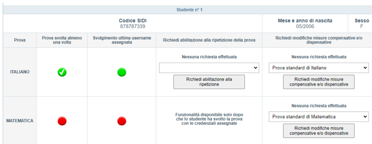
Figura 4: Gestione e Monitoraggio della somministrazione